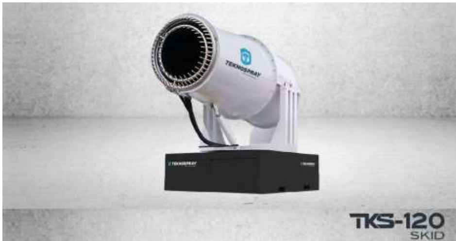
2-rasm. Teknospray tks-120 SKID texnologiyasi ko'rinishi.

SKID(2-rasm.) chang bosish tizimini taklif qilish mumkin. Bu zamonaviy texnologiya ishlab chiqarish changlaridan iqtisodiy va xavfsiz xalos bo'lishga imkon beradi. Bu darhol atrof-muhitning ifloslanishi va xodimlarning kasbiy kasalliklarini oldini oladi. Texnologik chang bostirish moslamasi qatori sanoat korxonalari maydonchalarida ishlab chiqarish changini olib tashlash uchun mo'ljallangan. Chang bosish moslamasi mikroskopik suv tomchilarini purkash printsipi asosida ishlaydi, ular havodagi chang zarralarini o'z ichiga oladi va bostiradi, hatto tizim o'rnatiladigan joydan ancha uzoq masofadagi ya'ni changlarni ham bostiradi. Texnologik chang bosish moslamasi nafaqar changlarni balki ba'zi zararli va zaharli gazlarni neytrallashtirish imkonini beradi. Texnologiyani qo'llashda qatori sanoat korxonalari maydonchalarida ishlab chiqarish changini olib tashlash uchun mo'ljallangan.